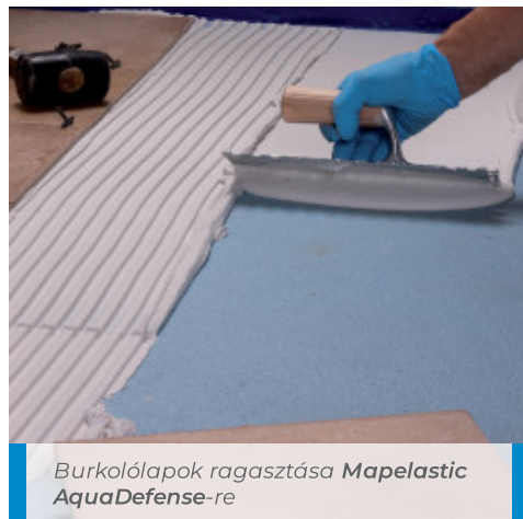
Burkolólapok ragasztása Mapelastic AquaDefense -re