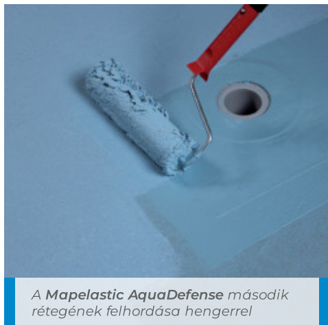
A Mapelastic AquaDefense második rétegének felhordása hengerrel