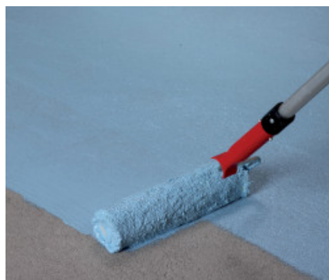
A Mapelastic AquaDefense első rétegének felhordása esztrichre