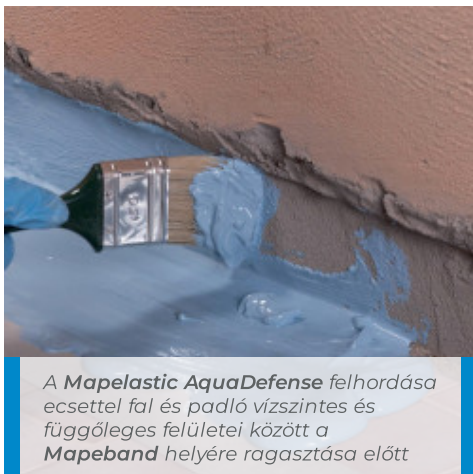
A Mapelastic AquaDefense felhordása ecsettel fal és padló vízszintes és függőleges felületei között a Mapeband helyére ragasztása előtt