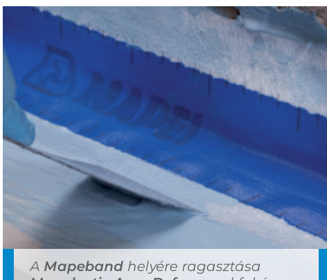
A Mapeband helyére ragasztása Mapelastic AquaDefense -vel fal és padló vízszintes és függőleges felületei között