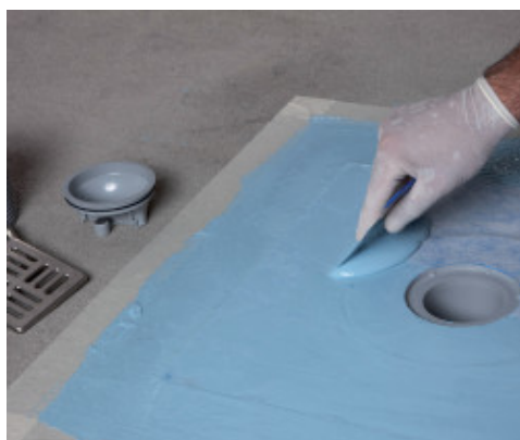
Drain Vertical impregnálása Mapelastic AquaDefense -vel

A lapok közötti fugahézagokat töltsse ki például Ultracolor Plus CG2WA osztályba sorolt, vagy Fugolastic -kal kevert Keracolor FF Flex vagy Keracolor GG cementkötésű fugázóhabarcsokkal vagy epoxi fugázóhabarccsal (például Kerapoxy , Kerapoxy Design vagy Kerapoxy CQ - szabványbesorolása: RG). A mozgási hézagokhoz használjon megfelelő hézagkitöltő-anyagokat a MAPEI termékválasztékából (például Mapesil AC -t, Mapesil LM -t vagy Mapeflex PU45 FT -t a követelményektől függően).