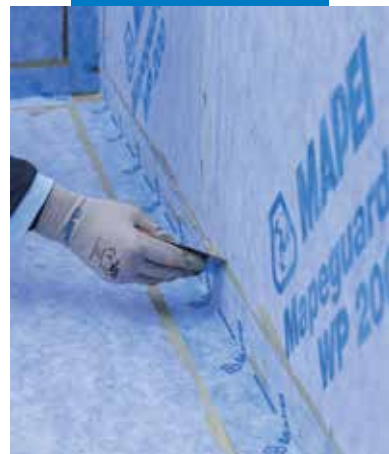
Mapeguard ST bedolgozása

A termékre vonatkozó referenciák kérésre rendelkezésre állnak, illetve a www.mapei.hu weboldalon hozzáférhetők.