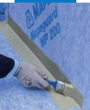
Mapeguard WP Adhesive bedolgozása a sarkok, hézagok tömítésére a Mapeguard ST bedolgozása előtt