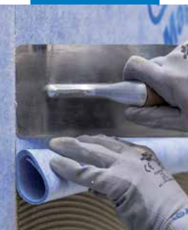
Második lemez elhelyezése