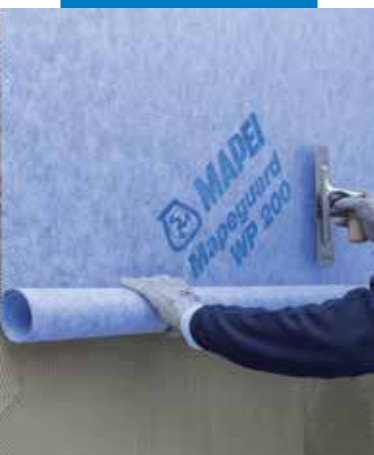
Mapeguard WP 200 fektetése