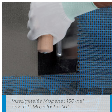
Vízszigetelés Mapenet 150-nel erősített Mapelastic-kal